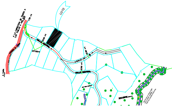
DETALLE DE AMARRE ESCALA 1:5,000