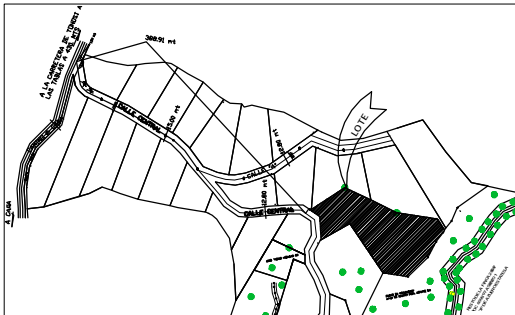
DETALLE DE AMARRE ESCALA 1:2,500